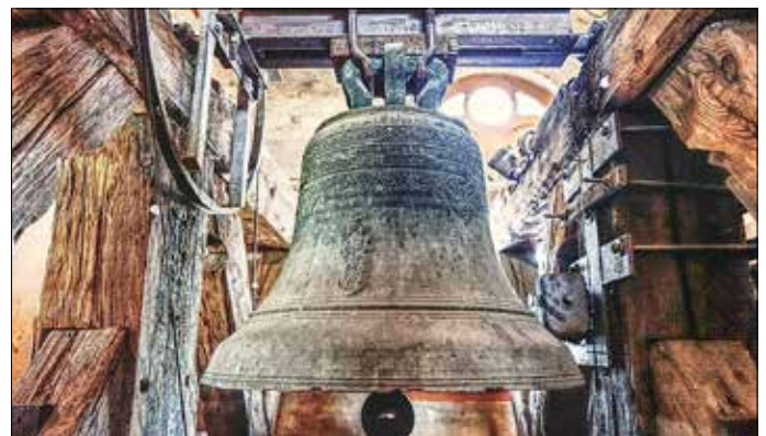
Abbildungen 2/3: Die Voillardglocke von 1663 im Turm der evangelischen Kirche Peitz