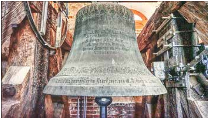
Glocke von 1612/1897 im Turm der evangelischen Kirche Peitz

se Glocke mit einem Durchmesser von über einem Meter bei einem Gewicht von etwa 700 kg als größte Glocke im Kirchturm der evangelischen Kirche und läutet jeden Sonn- und Feiertag zu den Gottesdiensten, anlässlich von Beerdigungen und auch zusammen mit allen anderen Peitzer Kirchenglocken in der Neujahrsnacht. Auf Grund ihrer Klangschönheit und Historie wurde diese Glocke in den beiden Weltkriegen nicht für die Rüstungsindustrie beschlagnahmt und blieb uns erhalten.