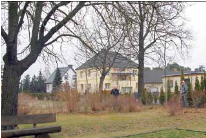
Die Freiflächen wurden beräumt.

Alle fleißigen Helferinnen und Helfer verschnitten Sträucher, beseitigten Wildwuchs und Unrat und harkten das letzte Laub und trockenes Gras aus Hecken und Rasen - schön ist er wieder geworden, unser Friedhof.