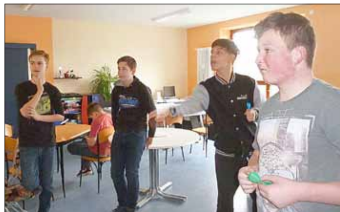
Spaß beim Darts

hieß es dann „Filmtag“ im Cari-Treff, um dem regnerischen Wetter zu entfliehen. Den letzten Ferientag nutzten alle zum gemeinsamen Spielen. Beim großen Spiele-Turnier, wobei sich die Kinder und Jugendlichen im XXL-Vier-Gewinnt, Darts, Airhockey, Monopoly sowie Stadt-Land-Fluss austesten konnten, hatten alle viel Spaß und wurden mit einer Urkunde sowie einem schmackhaften Eis belohnt.