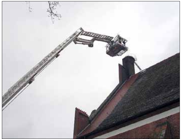
Das Storchennest auf der Kirche wird hergerichtet.

Am Samstag, dem 12. März 2016, fand auf Initiative der Storchfreunde in unserer Gemeinde ein spektakulärer Einsatz zur Erneuerung unseres Storchennestes auf der hiesigen Kirche statt.