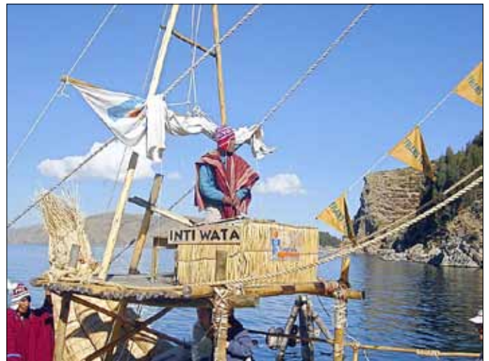
Schilfboot „Inti Wata“

Dann erlebten wir den Sonnenaufgang, als würde mit der Sonne das Leben auf die Erde zurückkehren. Ich entdeckte auch eine etwas verborgene Solaranlage, ganz ohne Strom schien es also auch bei den Uros nicht zu gehen.