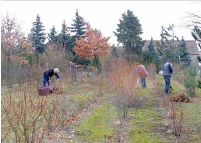
Mit der Harke im Einsatz.

Zum Frühjahrsputz sollten nun die letzten Relikte des letzten Herbstes und Winters beseitigt werden. Die ersten Ungeduldigen begannen bereits mit der Frühjahrsbepflanzung der Gräber, obwohl die Temperaturen noch keine richtige Frühjahrsstimmung aufkommen ließen. Zum Osterfest sollte aber auch der Friedhof sauber hergerichtet worden sein, schließlich hat sich die Gemeinde mit der Sanierung der Trauerhalle im vergangenen Jahr noch einmal so richtig „ins Zeug gelegt“ - schön ist sie geworden.