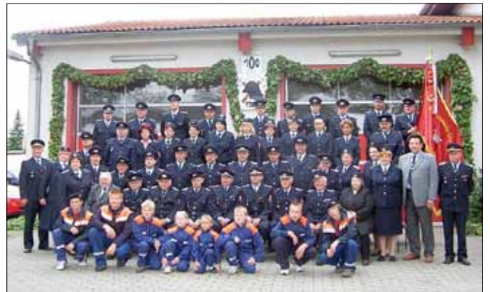
Erinnerung an das 100. Jubiläum der FF Drachhausen

Werte Bürgerinnen und Bürger des Amtes Peitz, einer der Höhepunkte des Jahres 2016 im Amt Peitz ist das 110. Gründungsjubiläum der FF Drachhausen. Zu diesem großen Ereignis laden wir, die Kameradinnen und Kameraden der Feuerwehr, alle Bewohner und Gäste des Amtes Peitz auf das Herzlichste am 28. und 29. Mai 2016 nach Drachhausen ein. Anlässlich unseres Festes, führt die Amtsfeuerwehr Peitz den traditionellen Amtsausscheid im Löschangriff durch. Die zeitlichen Abläufe entnehmen Sie bitte dem folgenden Ablaufplan.