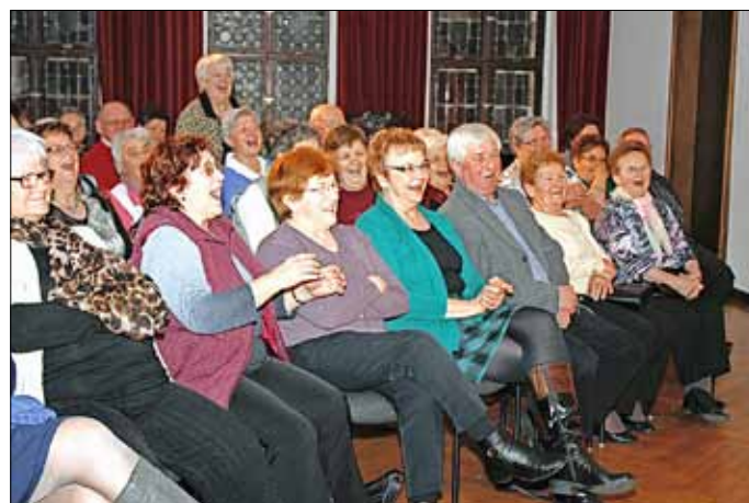
Heiterkeit und Szenenbeifall während der Aufführung