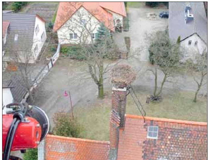
Blick aufs Nest aus der Storchelperspektive

Das Nest, mittlerweile auch schon in die Jahre gekommen, bedurfte einer größeren Reinigung und Erneuerung des Grundnestes. Die Bruterfolge der letzten Jahre waren nicht unbedingt von Erfolg gekrönt, teilweise sogar völlig ausgefallen und nun auch noch durch den Turmfalken gestört (oder auch nicht). Größte Sorge unserer Storchfreunde ist, der Storch könnte unserer Gemeinde ganz fernbleiben. So machten sich die Storchfreunde auf und organisierten diesen Einsatz. Einen positiv-ergreifenden Effekt hatte dieser Einsatz, die Arbeiten am Storchennest in luftiger Höhe ließen einen Rundblick aus der Storchelperspektive zu - so sieht also der Storch unser Dorf!