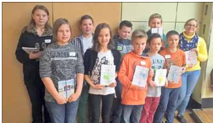
Die erfolgreichen, stolzen Teilnehmer