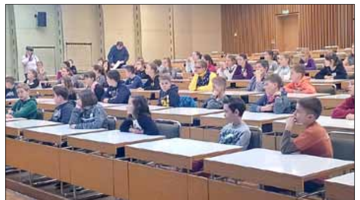
Treff im Hörsaal

Insgesamt waren wir 60 Schüler und Schülerinnen. Als alle Klassen da waren, wurden wir in Gruppen eingeteilt. Da wir zu zehnt waren, und leider immer nur 7 Teilnehmer in einer Gruppe sein durften, wurden 3 von uns in eine andere Gruppe eingeteilt. Aber das war nicht weiter schlimm, denn in dieser Gruppe waren nette Schüler und eine sehr nette Betreuerin. Wir gingen nun in unseren neuen Gruppen in einen anderen größeren Raum, den Hörsaal 3. Im Hörsaal wurde uns erklärt, was wir an diesem Tag so machen werden.