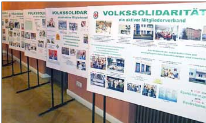
Erstmals wurde die Ausstellung zur Festveranstaltung der Volkssolidarität im Oktober 2015 gezeigt.

Die Volkssolidarität arbeitet heute als Einheit von Mitgliederverband und Interessenvertretung in einem Netzwerk mit der Volkssolidarität Spree-Neiße Sozialdienste gGmbH als anerkannter Dienstleister in der Alten- und Jugendhilfe.