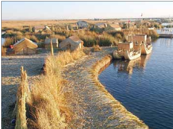
Blick auf die Insel

Am nächsten Morgen nahm uns in aller Frühe ein kleines Motorboot auf. Die Überfahrt zu den Schilfinseln dauerte zwar nur zwanzig bis dreißig Minuten, aber die extreme Kälte blieb mir trotzdem in unangenehmer Erinnerung. Lediglich das „Kreuz des Südens“ am Sternenhimmel schien etwas zu ermuntern.