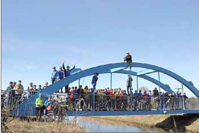
Alle 54 Teilnehmer auf dem „Blauen Wunder“

Damit wird traditionell die Radsaison für den Verein eröffnet. Die blauen Trikots werden in 2 bis 3 Gruppen 2016 jeden Donnerstag nach 18 Uhr wieder bis Ende Oktober auf den Straßen des Amtes Peitz und darüber hinaus zu sehen sein.