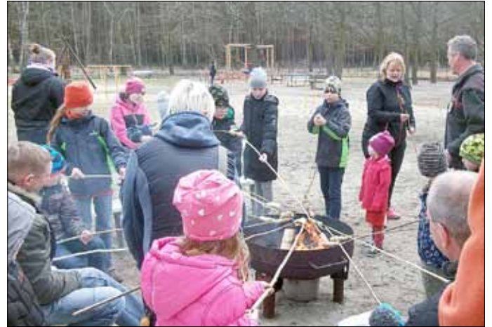
Stockbrot am Osterfeuer

Aber oh Schreck, es war nur noch ein buntes Ei in der Kiepe. Die anderen waren Herr Hase alle aus dem Korb gehopst als er mit seinem Fahrzeug über die holprigen Wege fuhr. Deshalb halfen die Kinder erst einmal beim Suchen und holten sich so ihre Osterüberraschung. Viele Spiele rund ums Ei vertrieben den Mädchen und Jungen die Zeit.