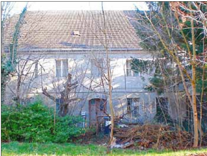
Dammzollstraße 27 heute, mittig