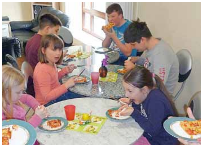
Pizza selbst gemacht

Nun endlich ist der Frühling wieder eingekehrt und das wurde farbig-fröhlich mit einem Oster-Familientag Mitte März gefeiert. In Zusammenarbeit der AWO-Seniorenbegegnungsstätte und dem Cari-Treff in der OASE 99 wurde ein kreatives Programm rund um Ostern für Besucher von 0-99 auf die Beine gestellt. Neben zahlreichen Oster-Bastelangeboten und Leckereien, wie frische Waffeln, konnten sich die Besucher an diesem Nachmittag auch an der traditionellen sorbischen Ostereier-Bemalung ausprobieren. Leider kamen in diesem Jahr nur wenig interessierte Besucher. Auch während der Osterferien wurde wieder ein abwechslungsreiches Ferienprogramm vom Cari-Treff gestaltet. Beginnend mit einem Chillout-Tag, einem österlichen Kreativtag „Rund ums Ei“ sowie einem sportlichen Spiel-Triathlon mit den drei Disziplinen „Airhockey, Billard & Darts“ vergingen die ersten Ferientage im gut besuchten Treff recht schnell.