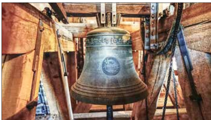
Abbildungen 7/8: Die beiden 1999 in Lauchhammer gegossenen Glocken.