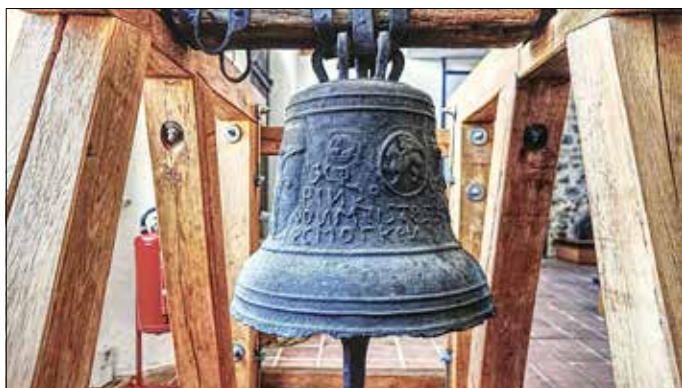
Abbildungen 4/5: Die Armesünderglocke von 1673 im Eisenhüttenmuseum.

Als letzte historische Glocke muss noch eine Eisenglocke aus dem Jahr 1673 erwähnt werden, die heute im Eisenhüttenmuseum ausgestellt ist. Die nicht besonders musikalische Glocke aus Gusseisen hat einen ganz besonderen kulturhistorischen Wert und wird deshalb im Glockenverzeichnis von Brandenburg in der höchsten Kategorie geführt. Sie wurde im Jahr 1673 in Peitz gegossen und gilt als die älteste datierte Eisenglocke in Deutschland. Johann Schmorken ist laut Inschrift der Gießer. Die Glocke entstand im zeitlichen Zusammenhang mit dem versuchsweisen Guss von Geschützrohren. Glockengießer waren meist auch Geschützgießer. Neben einem Kreuzifix und Engelsköpfen zierte das kurfürstliche Wappen die Glocke. Die Glocke hängt an einem historischen Holzjoch, jedoch zur normalen Schwingrichtung um 90 Grad verdreht. Sie konnte also nicht im herkömmlichen Sinne geläutet werden, sondern wurde offenbar nur angeschlagen. Welchen Verwendungszweck diese sogenannte Armesünderglocke hatte, ist leider nicht geklärt.