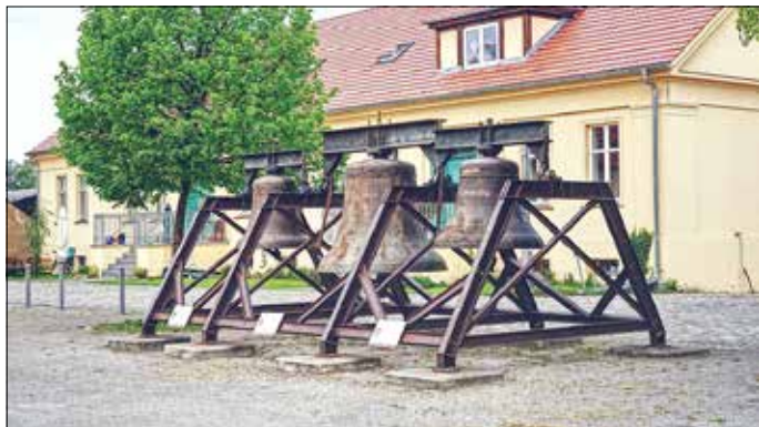
Die Berliner Stahlgussglocken auf dem Hüttenwerksgelände

Zum Schluss soll noch auf das Geläut auf dem Hüttenwerk eingegangen werden, welches seit etwa 10 Jahren hier hängt und zu wenigen besonderen Anlässen geläutet wird. Das ursprünglich vierstimmige Geläut stammt aus der Kirche am Hohenzollernplatz in Berlin und wurde von der Gießerei „Bochumer Verein“ 1948 bzw. 1959 aus Gussstahl hergestellt. Die größte Glocke wiegt 1564 kg.