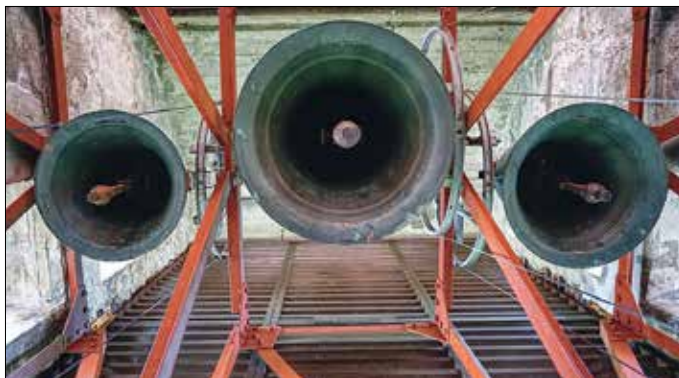
Die Glocken in der katholischen Kirche „St. Josef“ von Peitz.

Die katholische Kirche St. Josef der Arbeiter besitzt ein dreistimmiges Bronzegeläut mit einem „hellen“ Klang aus dem Jahr 1981, gegossen in der bedeutenden Glockengießerei Apolda (ehem. Fa. Schilling). Die erste Glocke hat ein Gewicht von 217 kg und heißt „St. Joseph“, die zweite Glocke hat ein Gewicht von 115 kg und den Namen „St. Maria“ und die dritte Glocke heißt „St. Petrus“ und wiegt 83 kg.