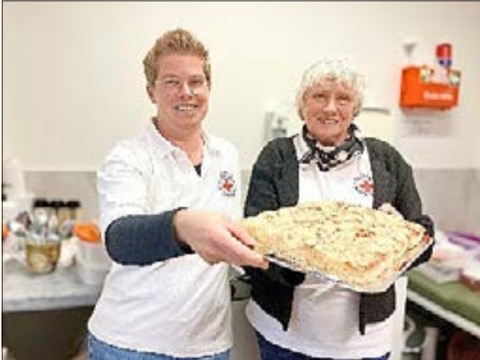
Ehrenamtliche Helferinnen unterstützen bei der Spenderverpflichtung

Ehrenamtliche Helferinnen und Helfer, die teilweise seit vielen Jahren regelmäßig die DRK Blutspendetermine in ihrer Region unterstützen, nennen immer wieder die Stärkung der Gemeinschaft, das Knüpfen neuer Kontakte und das schöne Gefühl, etwas Gutes getan zu haben, als Motivation für ihr Engagement. Die Freude, die man anderen Menschen mit seiner Arbeit bereitet, wird damit zur eigenen Freude.