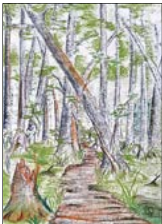
Weg durch das Sumpfgelände

Seit Ende des 10. Jahrhunderts entstanden im Zuge der Eroberung der ostelbischen Slawengebiete Heerstraßen in west-östlicher Richtung. Eine führte am nördlichen Rande (Luckau-Lieberose-Crossen) dieses Sumpfgebietes vorbei. Eine zweite verlief am südlichen Rande von Cottbus-Merzdorf-Heinersbrück nach Guben und Crossen und querte die Kleine Heide, die heute mit dem Kraftwerk Jänschwalde überbaut ist. Da man davon ausgeht, dass einst eine slawische Burg in Peitz gestanden hat, dürfte ein Weg längs des sandigen Streifens zur Kleinen Heide im Sumpf- und Niederungsgebiet rund um Peitz alternativlos gewesen sein und bereits länger als 1000 Jahre bestanden haben. Daher darf vermutet werden, dass der Weg vom Peitzer Burgberg zur Kleinen Heide zumindest bis zum Bogen am Alten Friedhof den Verlauf der heutigen Dammsollstraße entsprach und dann geradewegs die Heerstraße erreichte. Zwischen Erlen, Eichen und Elsen, teilweise als Knüppelweg im sumpfigen Gelände ausgelegt, blieb das Verkehren auf diesem Weg mühsam und zu Hochwasserzeiten unpassierbar.