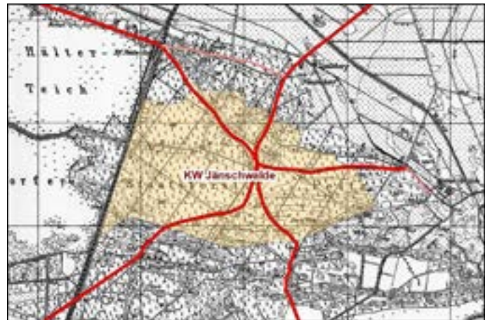
Der Stern in der Kleinen Heide östlich des Hälter- und Neuendorfer Oberteiches, heute bebaut mit dem Kraftwerk Jänschwalde, Hintergrundkarte TK25 von 1910

Dieser Knüppeldamm war bis Mitte des 16. Jahrhunderts die einzige überregionale Fuhrmannsstraße, die durch das Peitz umschließende dem Spreewald gleichende unpassierbare Sumpf- und Mooregebiet führte.